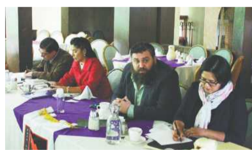
TIJUANA.- La Federación de Colegio de Valuaciones Delegación Baja California, realizó la segunda reunión de 2018, en la cual se analizó la problemática de la valuación en la Entidad.

"Quienes tienen lugar en el consejo estatal de valuación son únicamente representantes de los municipios, es decir, funcionarios públicos que no necesariamente tienen la especialización o el conocimiento al respecto; en esta ocasión hay un solo miembro que es el representante del municipio de Tijuana, de ahí en fuera nadie más, van